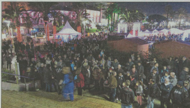
Mise en scène de toute beauté pour le spectacle de projections à la basilique, et dans les rues raphaëloises.