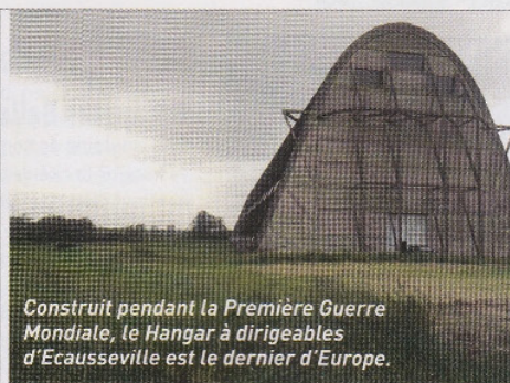
Construit pendant la Première Guerre Mondiale, le Hangar à dirigeables d'Ecausseville est le dernier d'Europe.