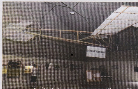
À côté du hangar, un espace d'exposition retrace l'histoire du site et de sa construction.